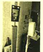
玄関に設置していたカメラ式温度計