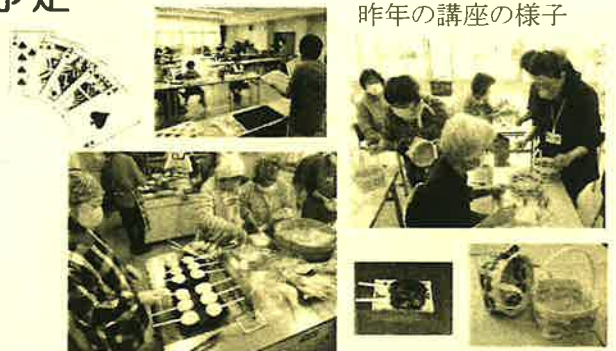
昨年の講座の様子