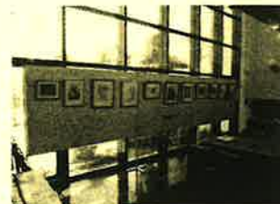
「三郷小・東栄小PTA絵画サークル」の作品展示