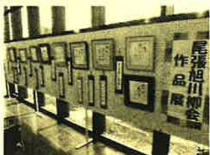
「尾張旭川柳会」の作品展示

藤池公民館では、1階ロビーを利用して公民館で活動するグループの作品展示を行っています。3月27日から4月24日までは「尾張旭川柳会」さんの川柳、5月9日～6月13日までは「三郷小・東栄小PTA絵画サークル」さんによる水彩画の作品展示が行われました。